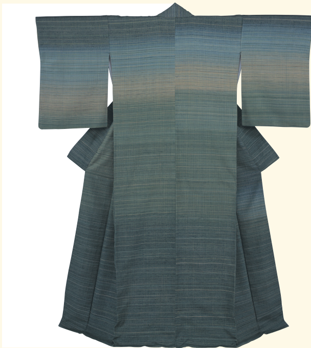
《鈴虫》| 1959年 | 滋賀県立美術館蔵

Curator: Yamaguchi Mayuko (Shiga Museum of Art)